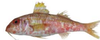
Triglia di fango