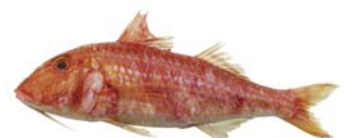
Triglia di scoglio